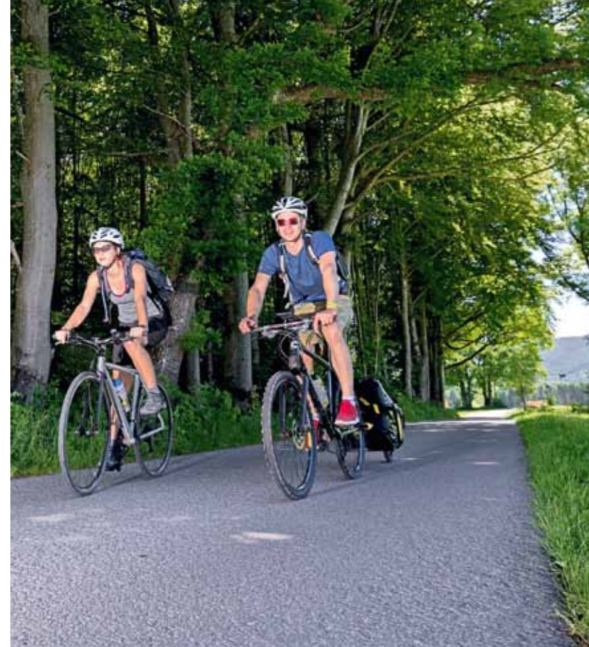
Rollt gut: Die meisten Wege sind asphaltiert und ohne viel Verkehr.

Unsere erste Etappe führt vom Bahnhof in Bad Tölz über Gmund am Tegernsee und weiter bis an den Schliersee. Auf dem Campingplatz bekommen wir mit unserem kleinen Zelt einen Stellplatz direkt im Schilf am Ufer. Am nächsten Morgen brechen wir auf, bevor wir Spaziergängern