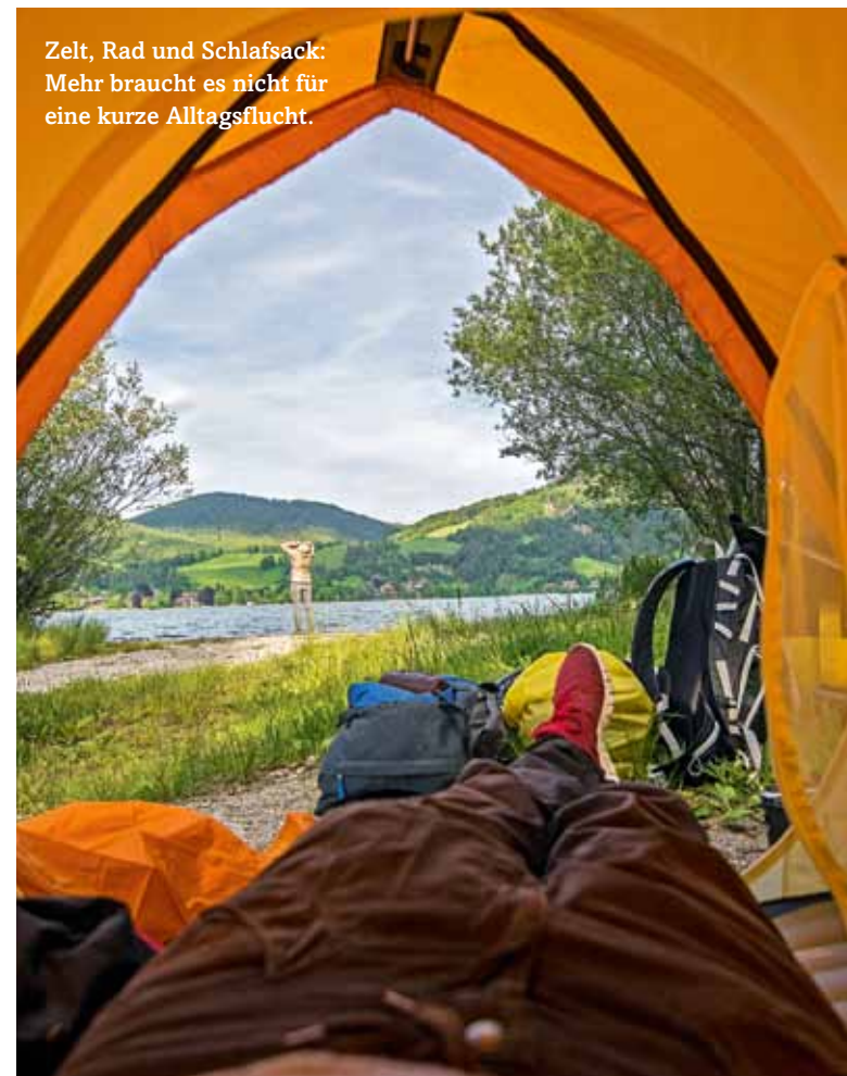
Zelt, Rad und Schlafsack: Mehr braucht es nicht für eine kurze Alltagsflucht.

mit Zwiebeltürmchen vor prachtvollem Alpenpanorama. In Piding, direkt am Ufer der Saalach, liegt unser nächster Campingplatz. Als kurz nach uns zwei Familien ebenfalls mit Rädern auf den Platz rollen, bin ich beeindruckt. Die vier Erwachsenen haben sechs Kinder dabei, wovon gerade mal eines selbst radelt. Der Rest ist auf