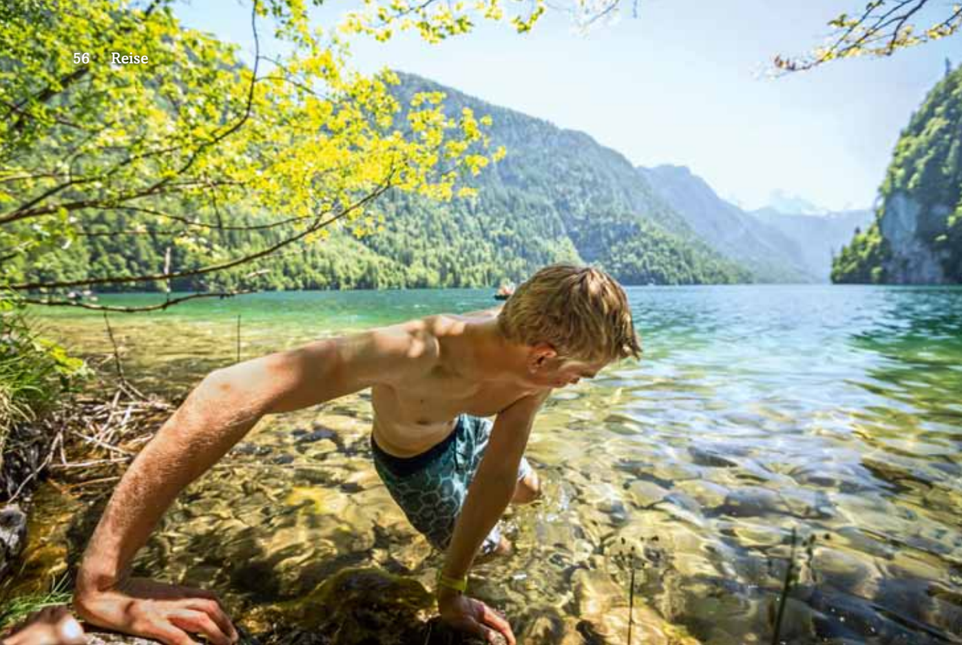
Kühlung für die geplagten Oberschenkel. Das große Badefinale im Königssee.